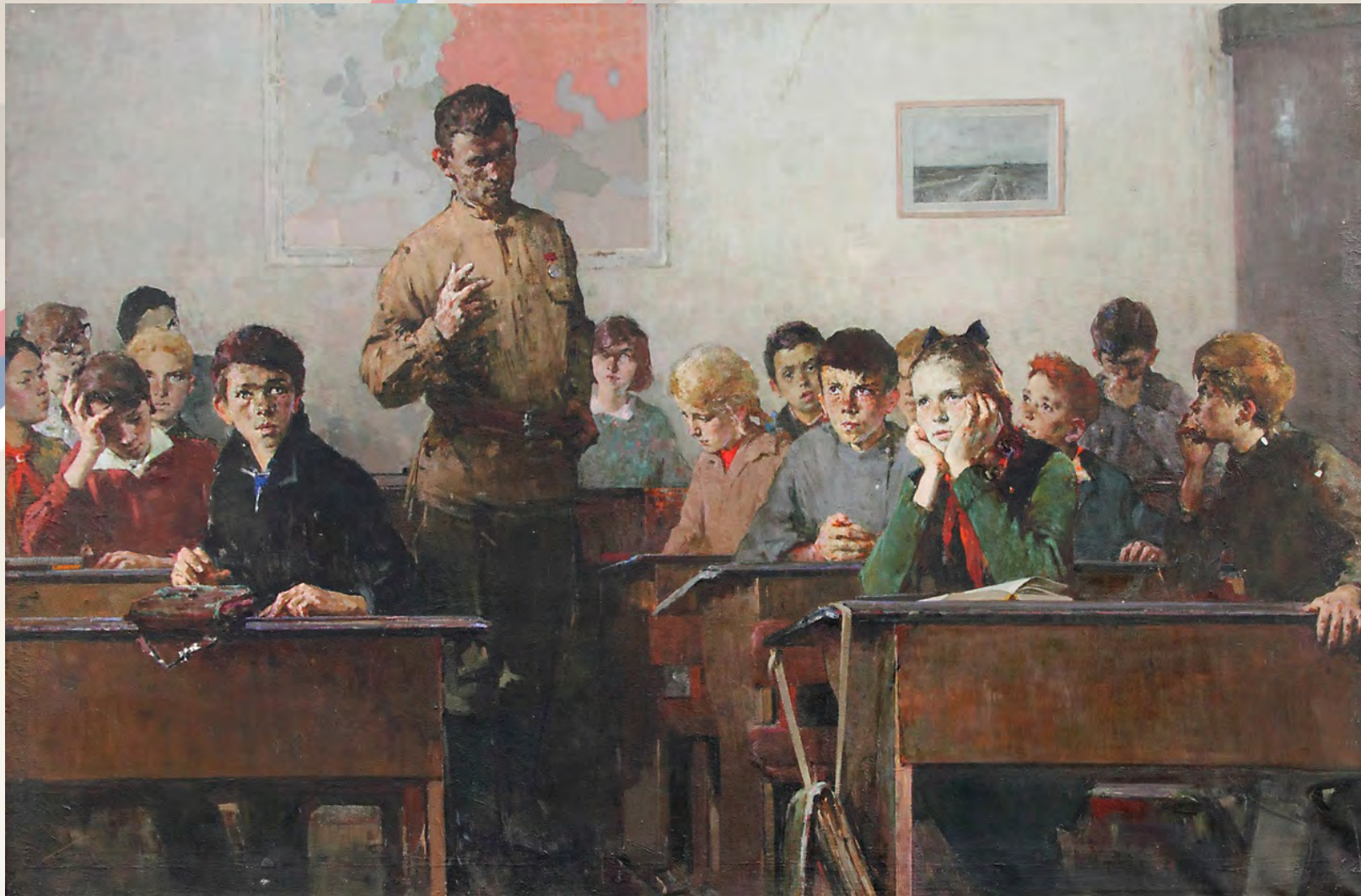
Невельштейн С.Г. Урок истории в 1944 году. 1967 г.

«Всё развитие человека умственное и нравственное выражается в направлении его внимания. Возбудите в человеке искренний интерес ко всему полезному, высшему и нравственному, - и <...> он сохранит своё человеческое достоинство»