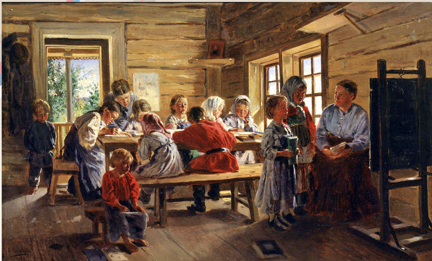
Маковский В.Е. В сельской школе. 1883 г.

«... Каждая школа должна хорошо знать среду, к которой принадлежат дети, воспитываемые в ней, и должна, сколько можно, бороться с вредными влияниями этой среды, давая полный простор влияниям хорошим»