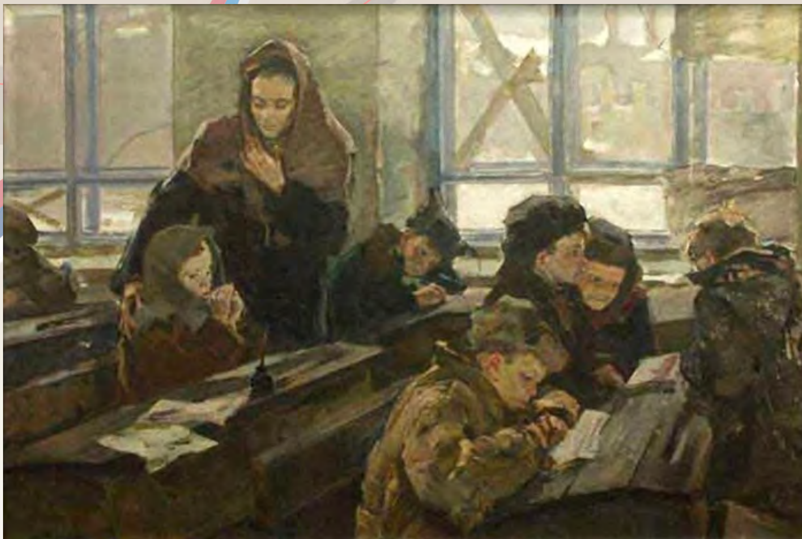
Башкевич О. Первый урок в 1944 году. 1967 г.

«Сильное развитие нервной системы умственным трудом даёт необыкновенную живучесть телу человека. <...> люди, привыкшие к умственным трудам, выносят перемену климатов, гурной воздух, недостаток пищи, отсутствие движения не хуже, а часто и лучше людей, у которых сильно развиты мускулы, но слабо и вяло действуют нервы»