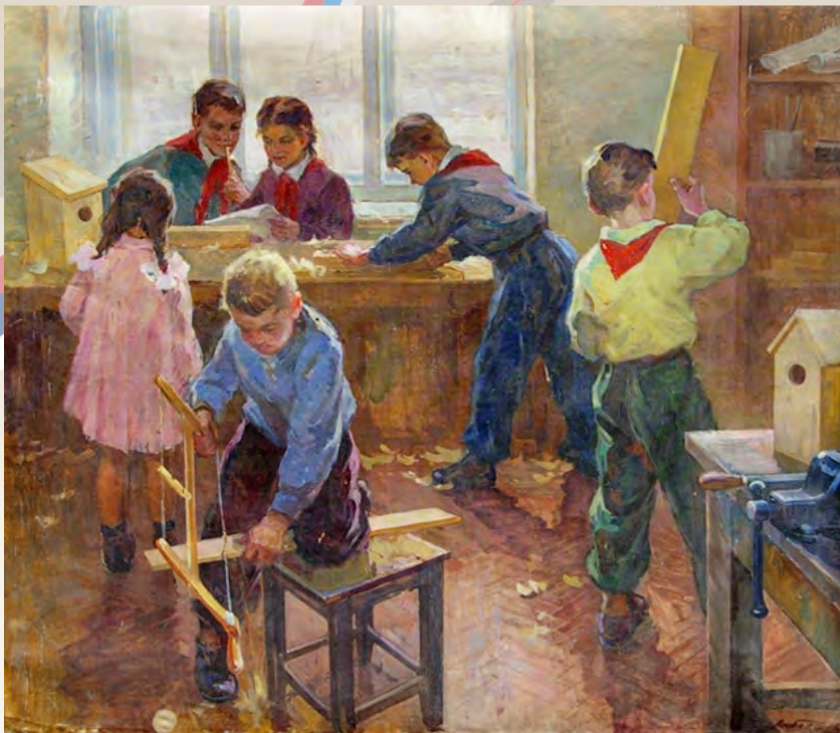
Любавин Ю. На уроке труда. 1961 г.

«Учение, лишённое всякого интереса и взятое только силой принуждения, убивает в ученике охоту к овладению знаниями. Приохотить ребенка к учению гораздо более достойная задача, чем приневолить»