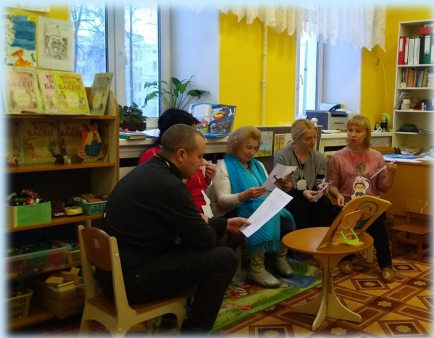
Викторина по басням И.А. Крылова