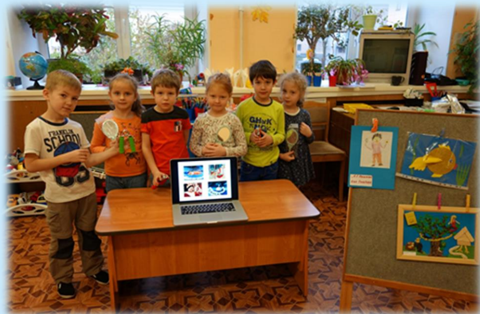
Проект «Путешествие по сказкам А.С. Пушкина»